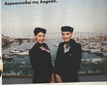
Αεροσυνοδοί της Aegean.